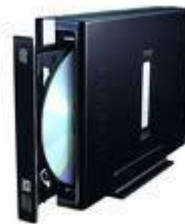
Graveur DVD externe